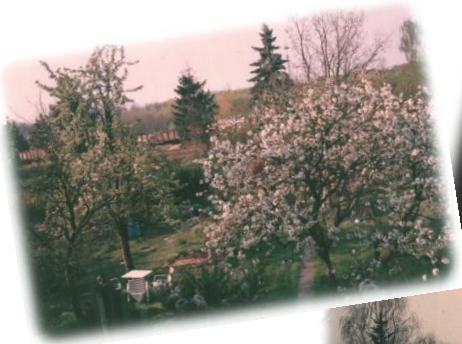
Hübsche Fotos aus der Vergangenheit.